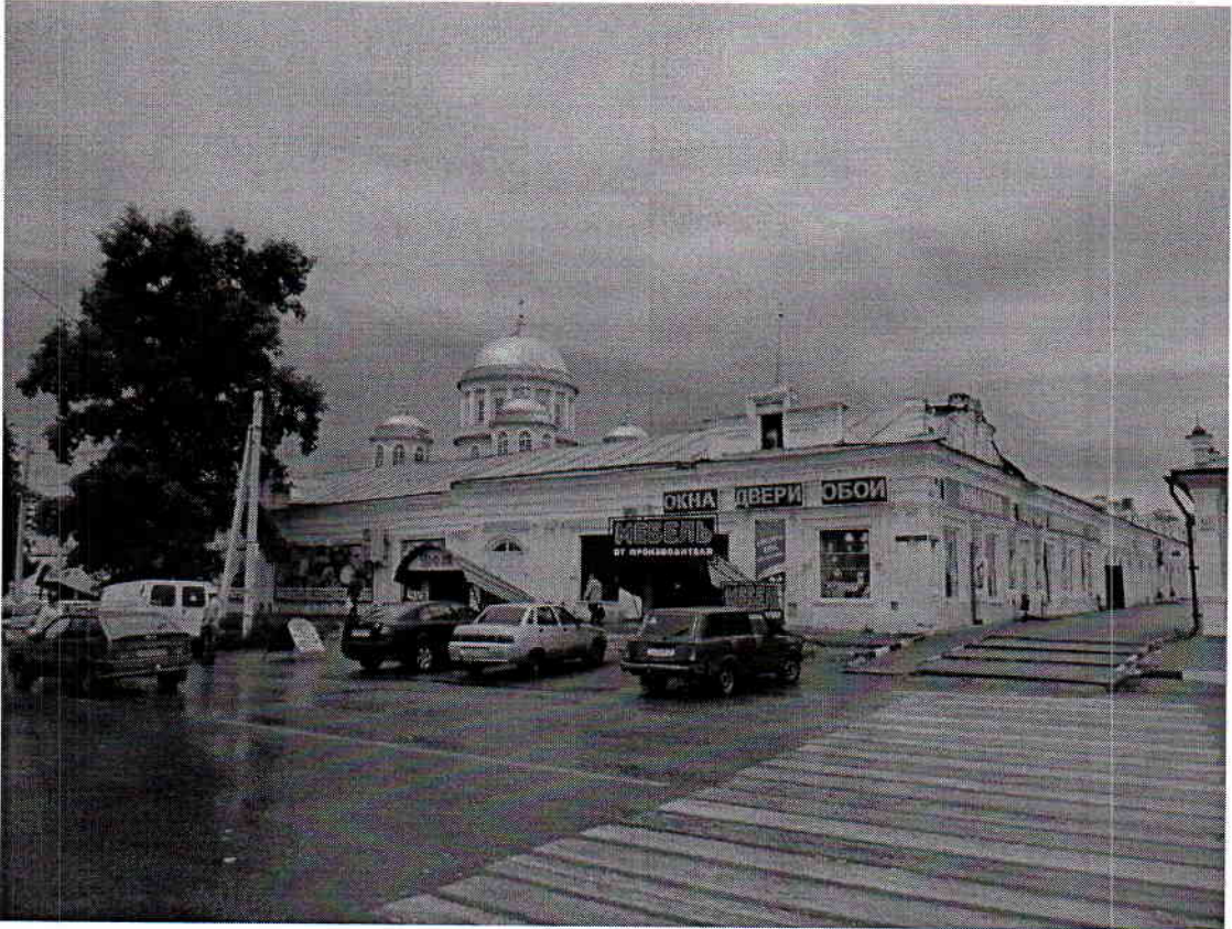
Общий вид ул.ул. Мира - Интернациональная