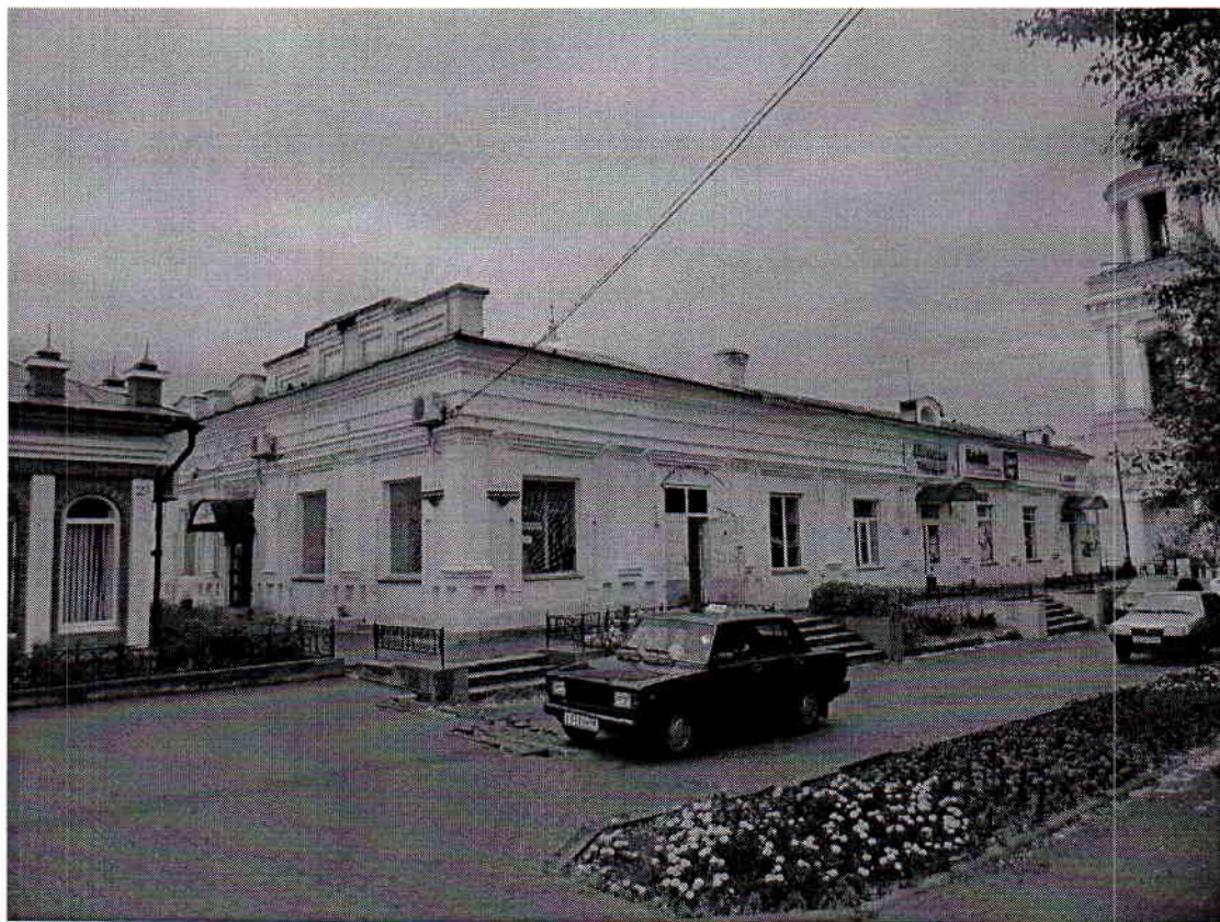
Общий вид. Ул.ул.Советская-Мира