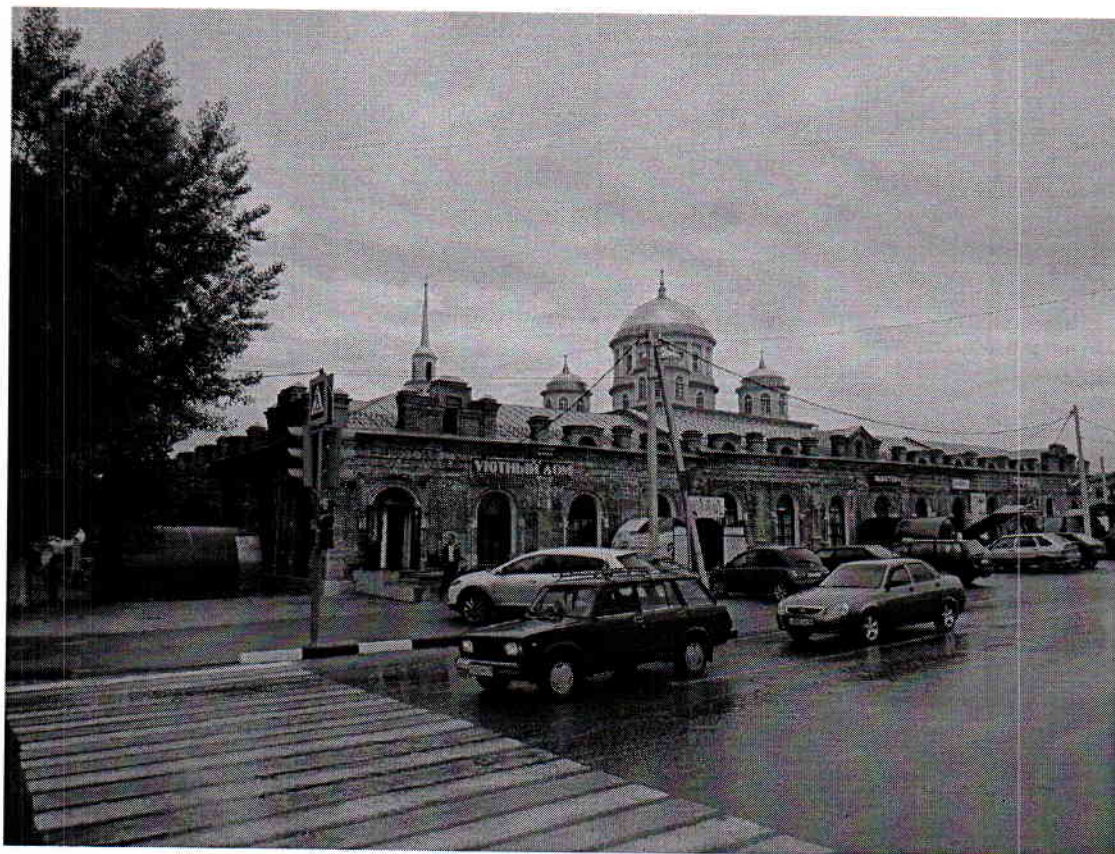
Общий вид ул.ул. Интернациональная - Почтовая